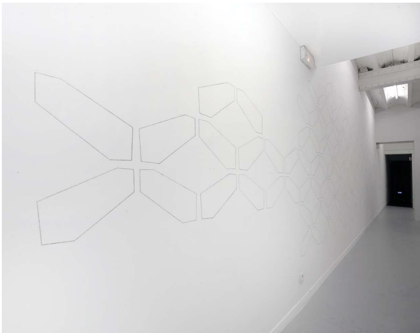
Wall drawing ( camera della morte ) 2009 Pencil, dimensions variable © Charles Mason