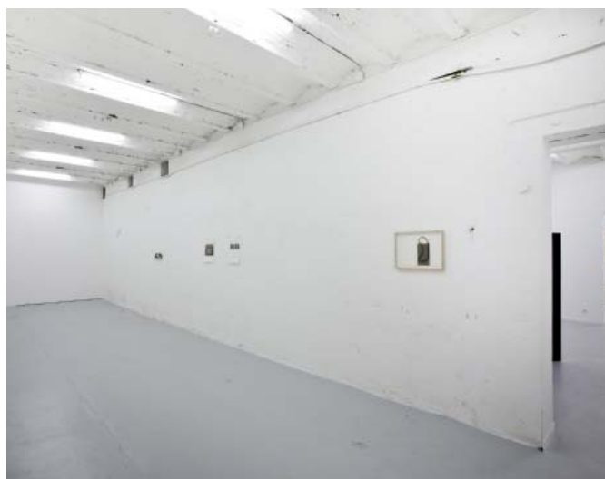
Installation view : All drawings 2009