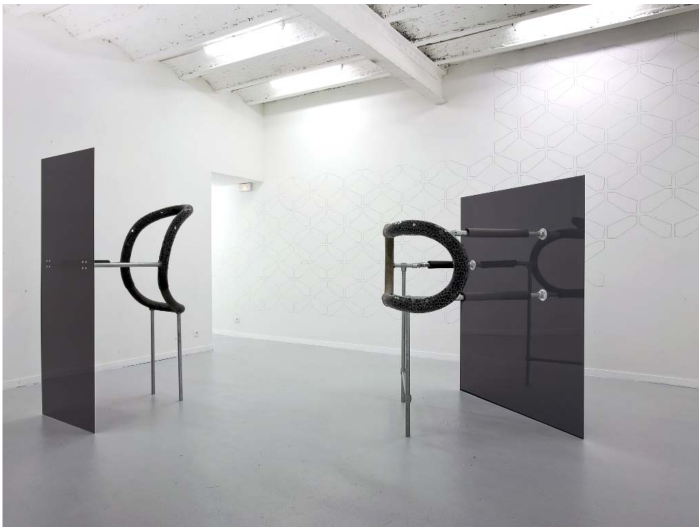
Installation view