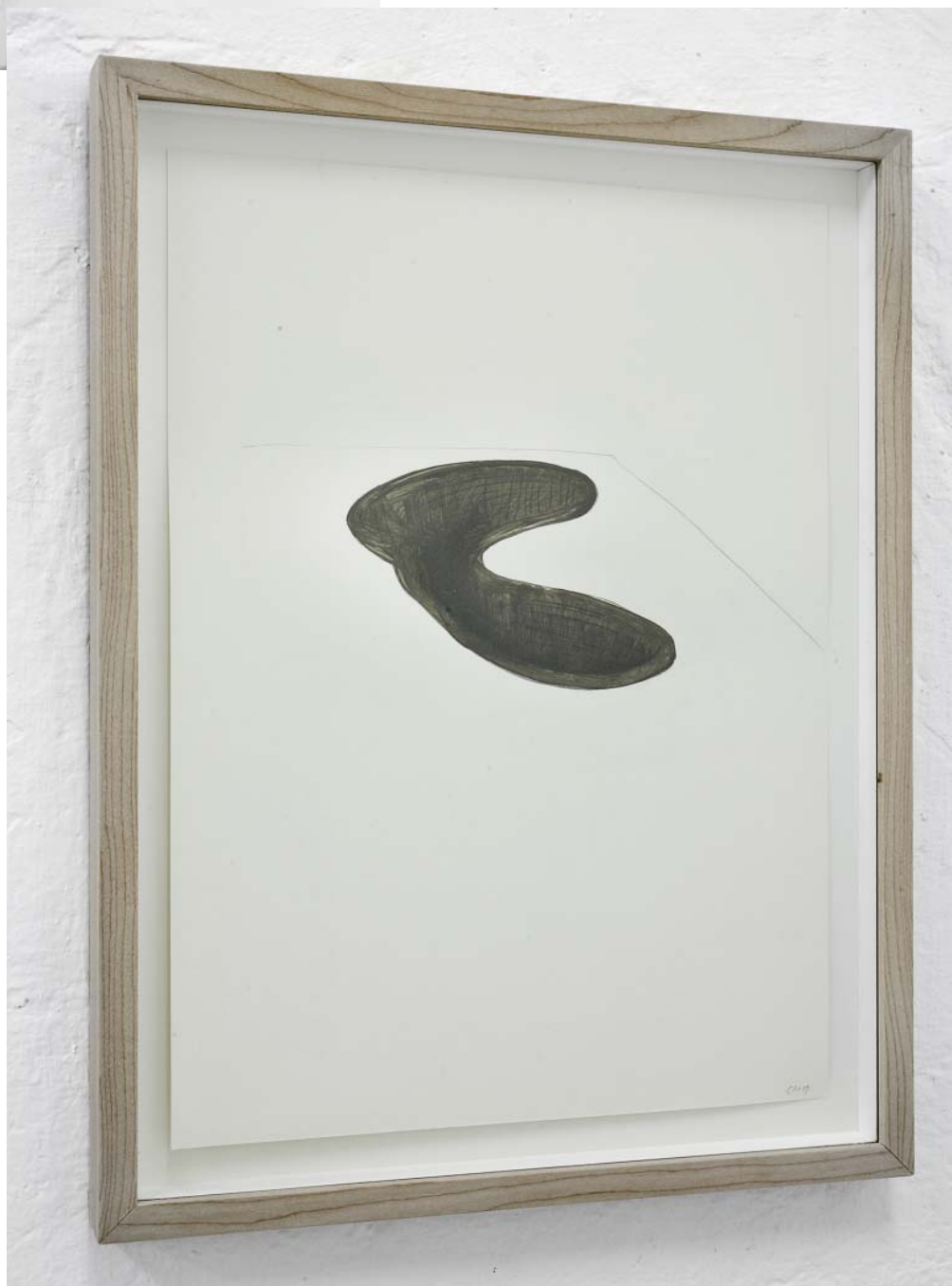
Sans titre 2009 Pencil and paint on paper, 50 x 38 cm framed © Charles Mason