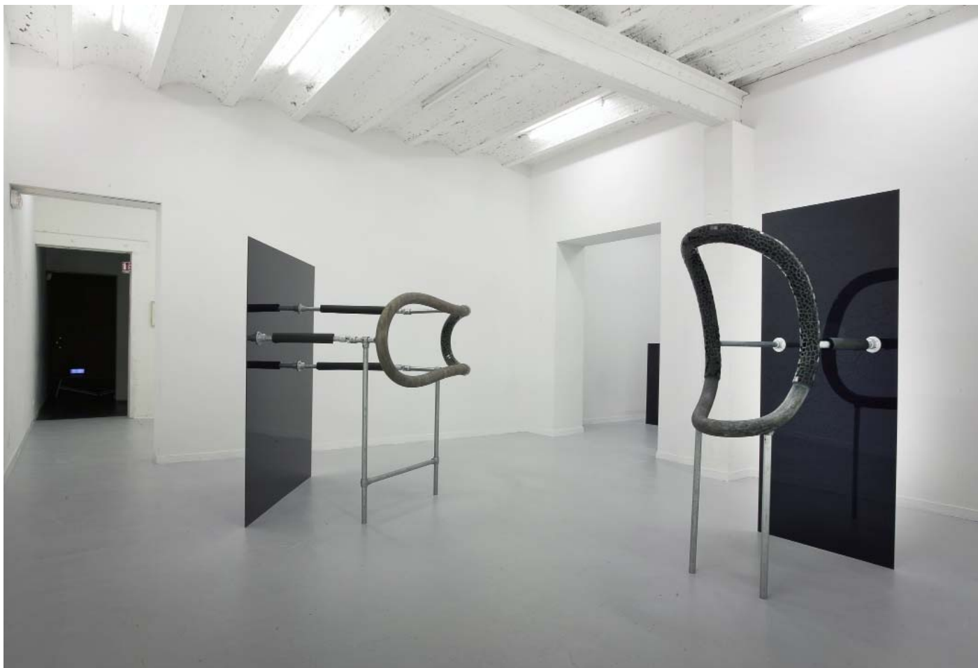
Installation view