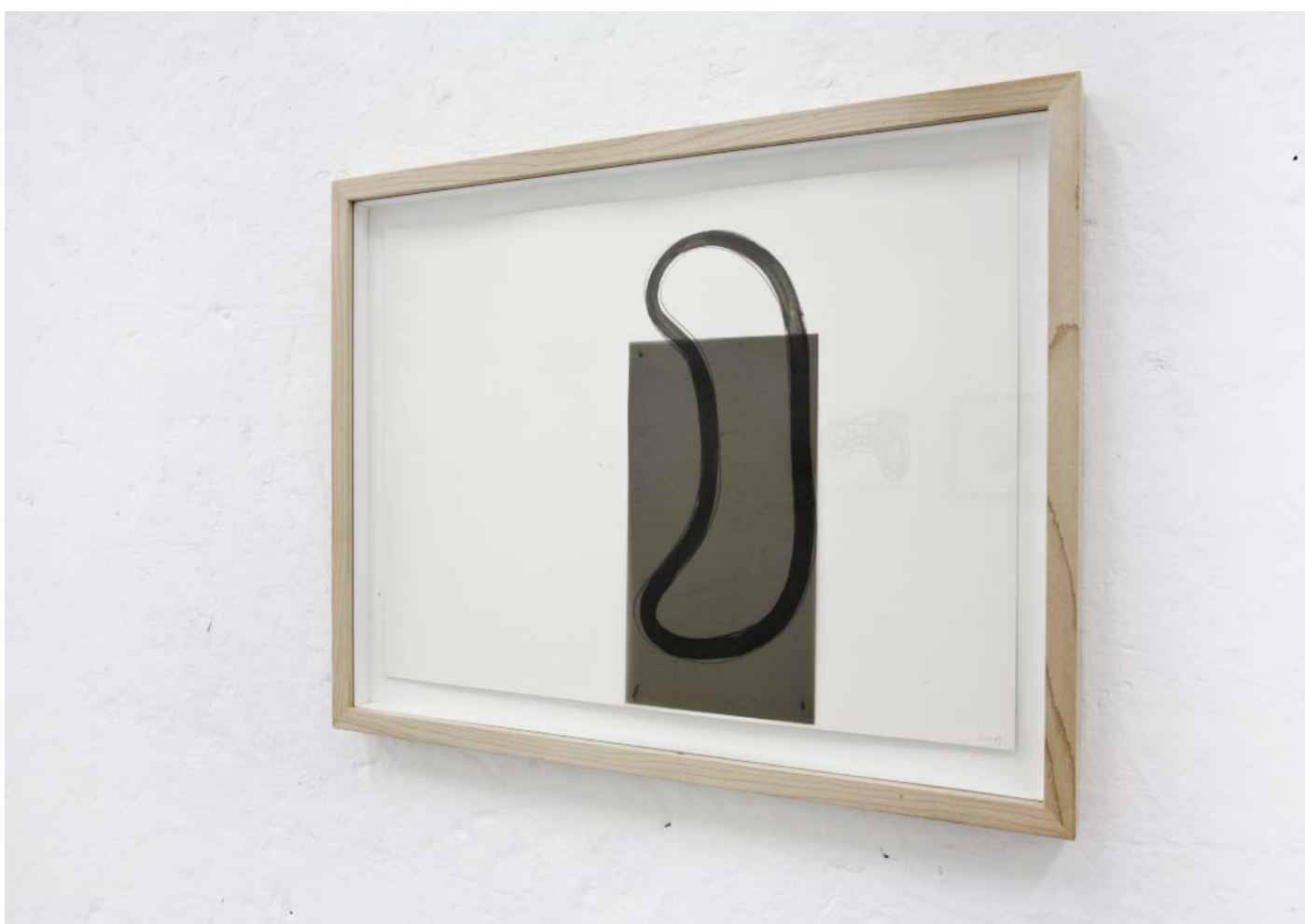
Sans titre 2009

Collaged plastic, paint and pencil on paper, 38 x 50 cm framed © Charles Mason