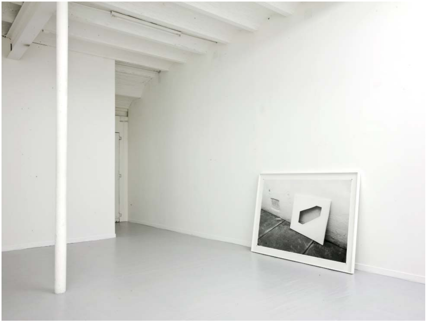
Wall drawing 2007 / 08 Digital photographic print 154 x 174 cm Framed ©Charles Mason