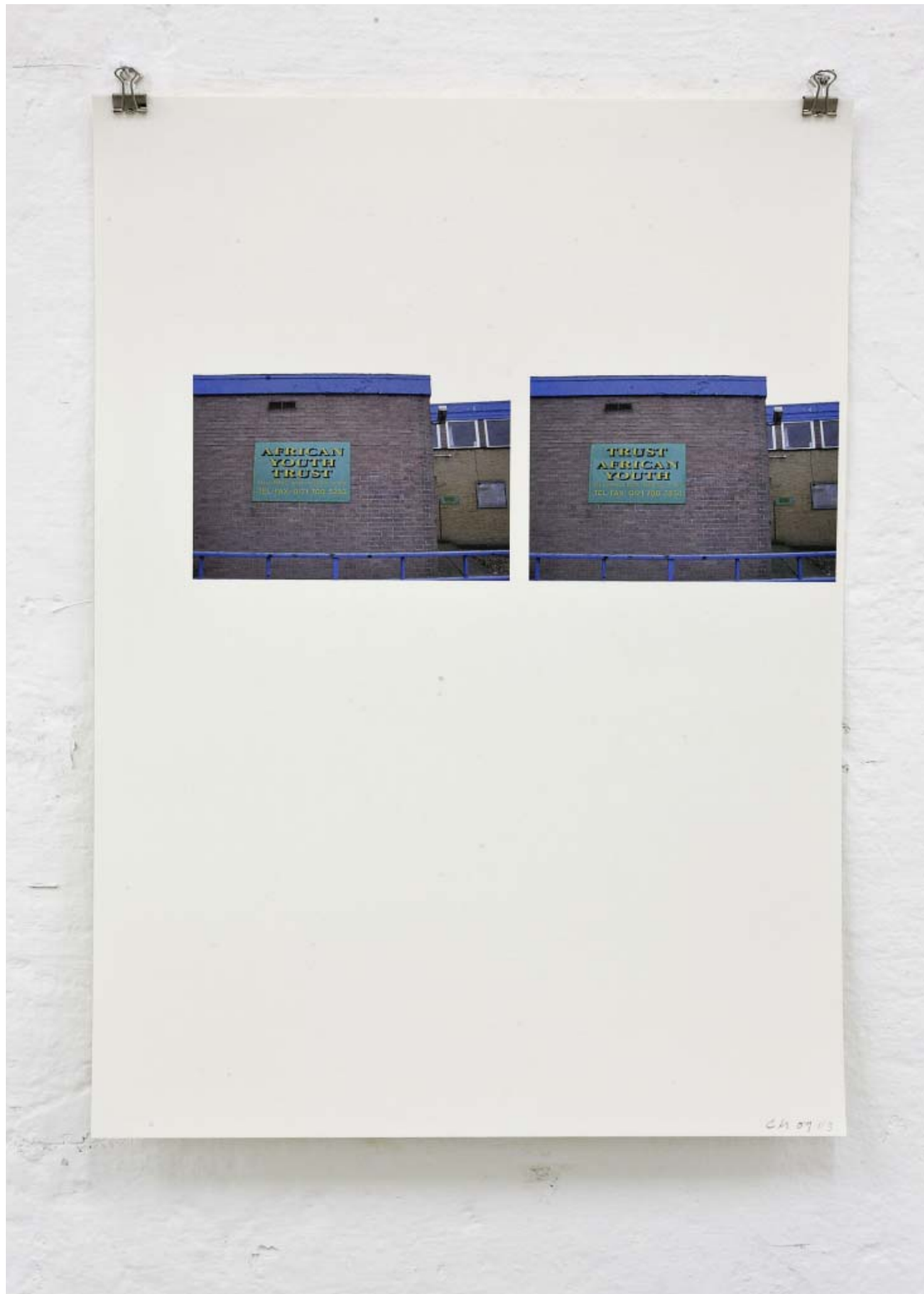
Trust 2009 Digital print, 42 x 32 cm ©Charles Mason